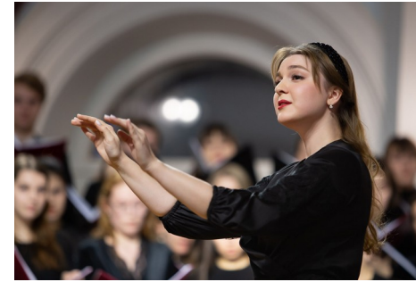
Хормейстер любительского вокального или хорового коллектива