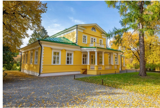
Большеболдинский м. о. «Усадьба Пушкиных в Болдине»