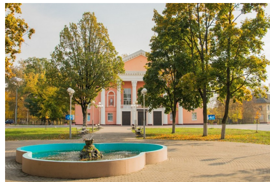
Володарский м. о., «ГДК»