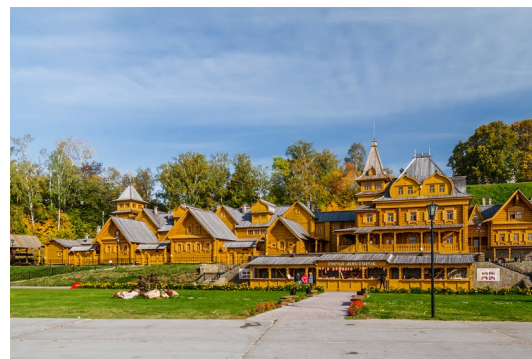
Городецкий м. о., «Город мастеров»