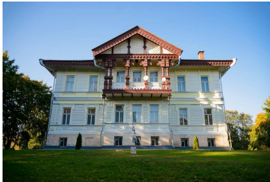
«Усадьба французского барона Антуана-Анри Жомини»