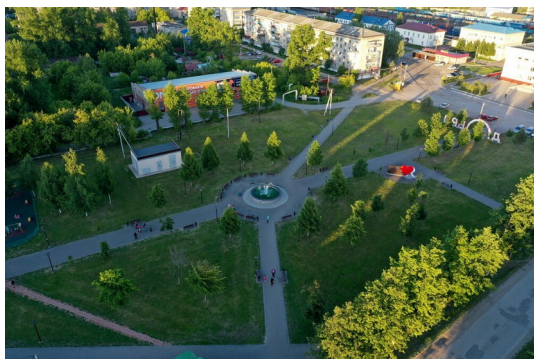
Г. о. г. Шахунья, «Парк Победы»