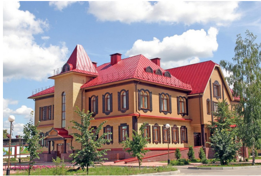
Г. о. Семеновский., «Музейно-туристический центр «Золотая хохлома»