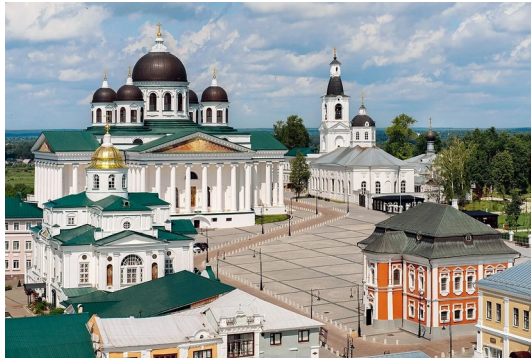
Г. о. г. Арзамас, «Соборная площадь»