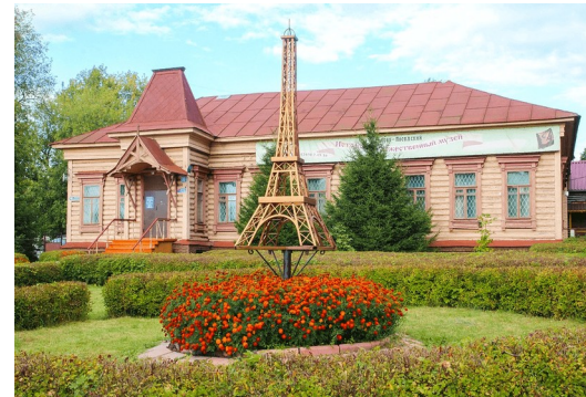
Павловский м. о., «Историко-художественный музей»