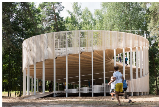
Г. о. г. Выкса, «Павильон будущего»