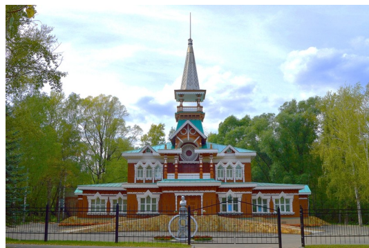
Г. о. г. Кулебаки, «Народный дом»