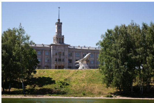
Г. о. г. Чкаловск, «Музей В. П. Чкалова»