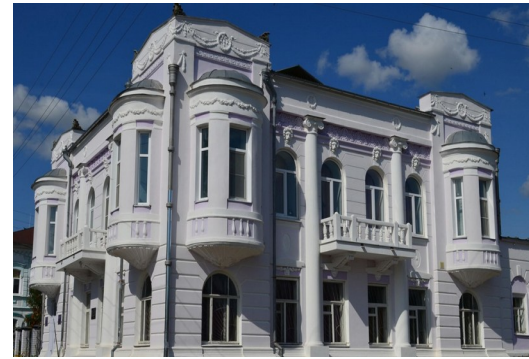
Большеболдинский м. о., «Дом Монева»